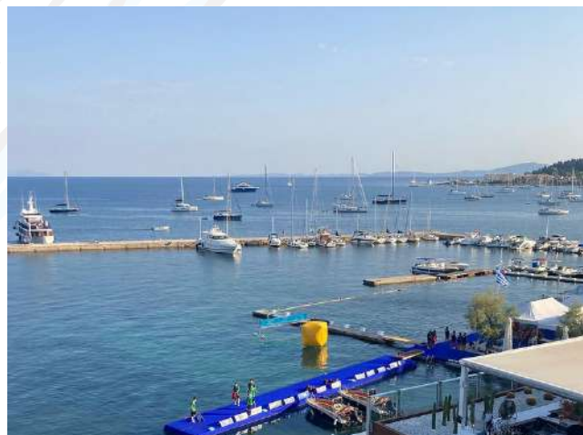
Text: DSV/LSVSA Fotos: Stefan Döbler - Instagram