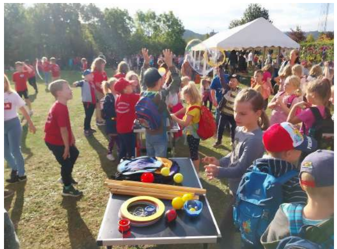
Text und Fotos: Harzer Schwimmverein 2002 e.V.